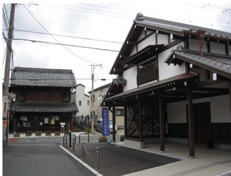
「神輿をはじめとする行徳の歴史や文化を紹介し、地域の魅力を発信する行徳ふれあい伝承館」 国登録有形文化財である旧浅子神輿店（左）と休憩所（右）