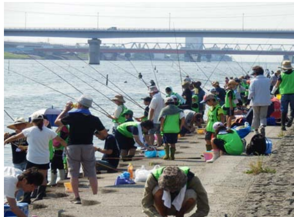
【江戸川ではぜ釣り大会】