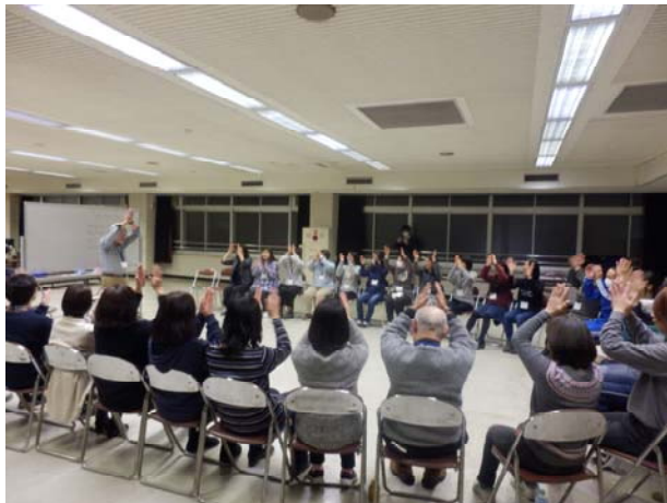
【言葉で 歌で 体で 表現を楽しもう】

※令和2年度は29人の応募があったが、新型コロナウイルス感染症拡大防止のため中止とした。