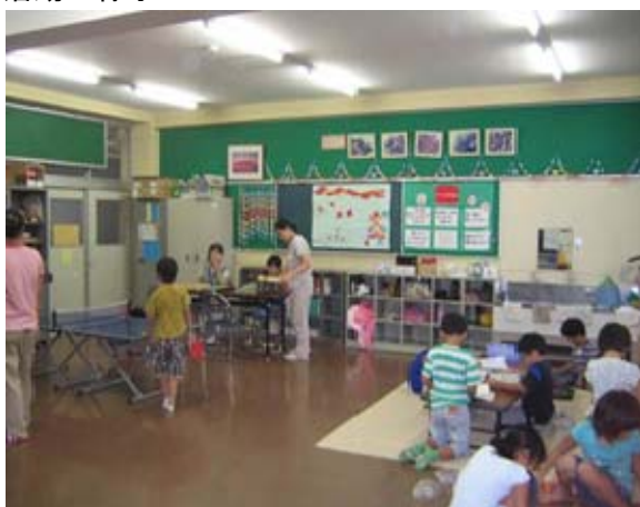
卓球など、置いてある玩具で遊んでいるところ