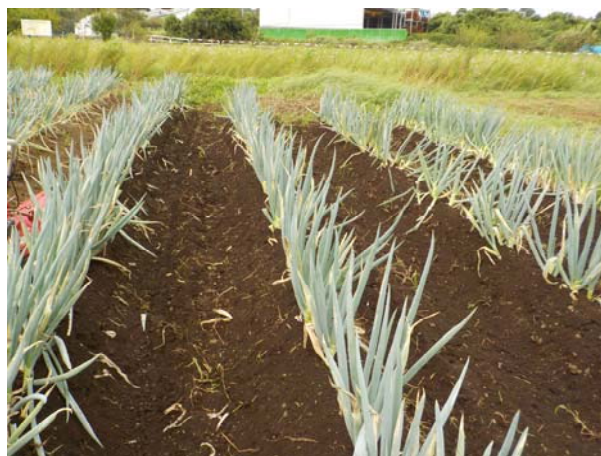
長ねぎ畑 収穫前の様子