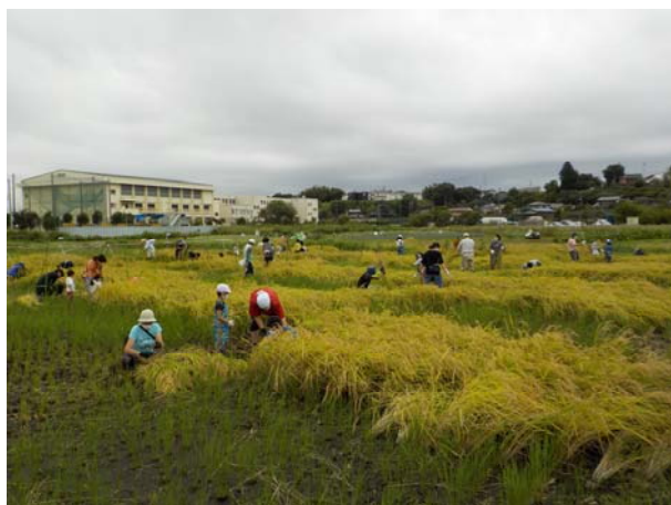
子ども水田 稲刈りの様子

※令和2年度は、新型コロナウイルス感染症拡大防止の観点から活動回数を減らし、感染拡大を防止する対策を講じたうえで「稲刈り」と「野菜の収穫」を実施した。