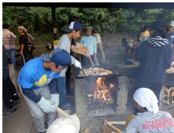
【トレーニングキャンプで野外炊事】