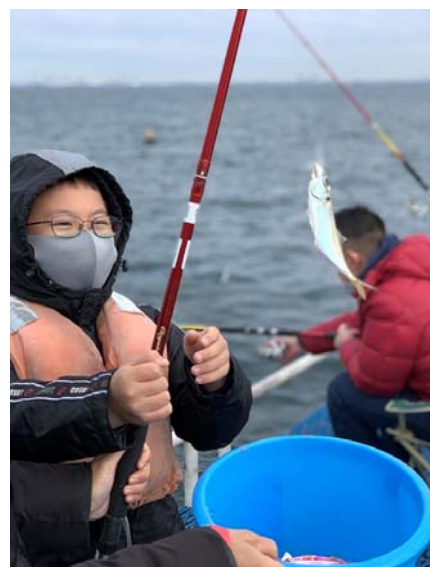
新型コロナウイルス感染対策を講じながらの「親子海釣り体験」（下貝塚中BCC）