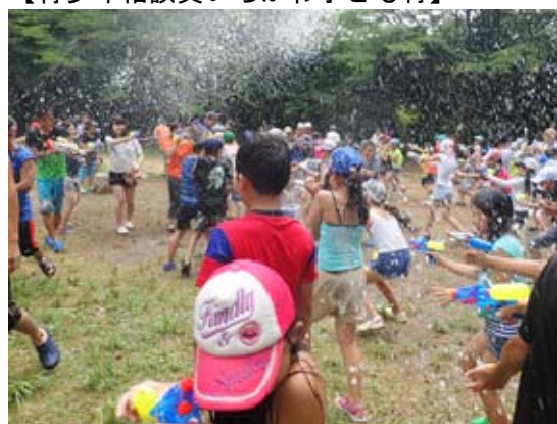
【水遊びを思い切り楽しもう】