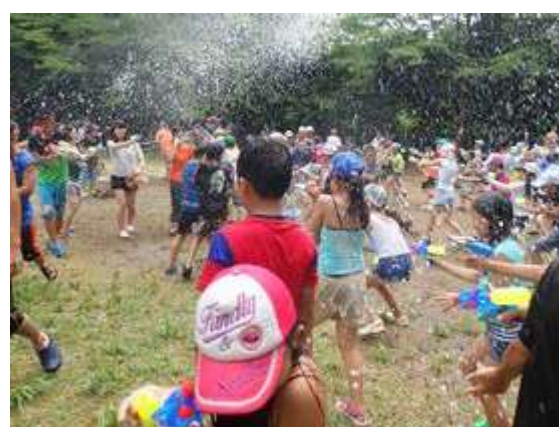
青少年相談員いちかわ子ども村 水遊びを思い切り楽しもう