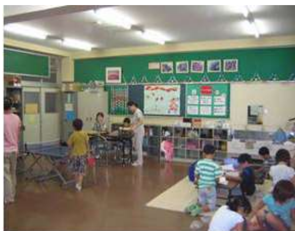
活動の様子 卓球など、置いてある玩具で遊んでいるところ