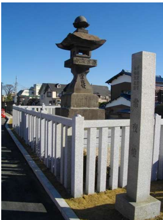
常夜灯公園内に設置された常夜灯