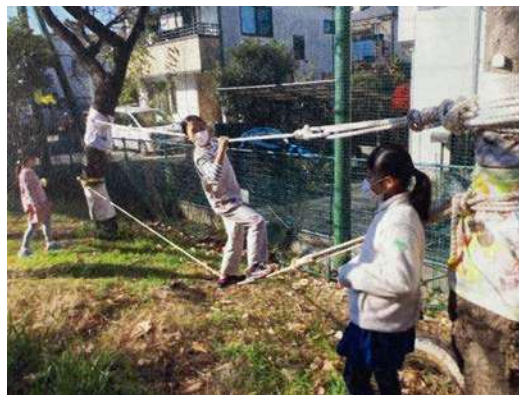
ロープを張った自由遊びの場（第二中BCC）