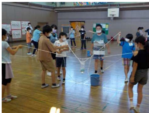
爆弾処理班というゲームでの様子

※令和3年度は、新型コロナウイルス感染拡大防止のため、講習回数及び内容を変更して実施した。