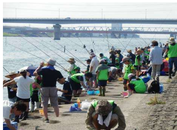
江戸川ではぜ釣り大会