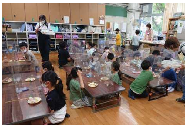
楽しいおやつ時間