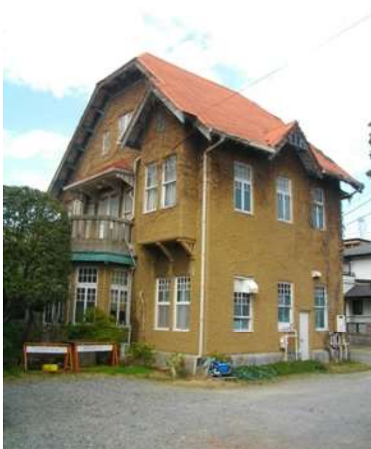
国登録有形文化財である西洋館倶楽部（渡辺家住宅）