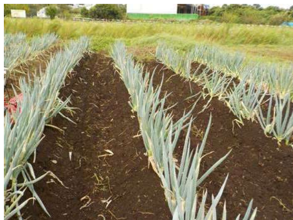
長ねぎ畑 収穫前の様子