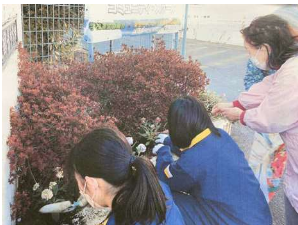
地域学校協働活動の一環としての 中学校生徒と環境整備活動（東国分中BCC）