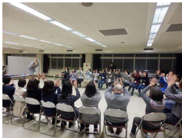
言葉で 歌で 体で 表現を楽しもう

※令和3年度は22人の応募があったが、新型コロナウイルス感染症拡大防止のため中止とした。