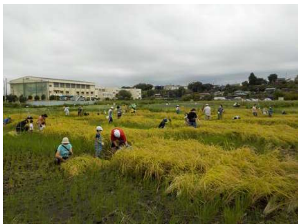
子ども水田 稲刈りの様子