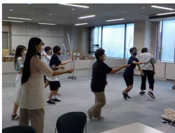
わんぱくセミナーボランティアの事前練習

※令和3年度は、新型コロナウイルス感染拡大防止のため、講習回数及び内容を変更して実施した。