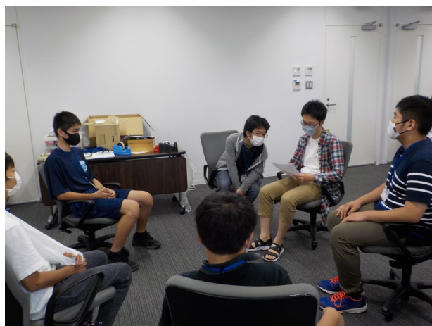
青少年リーダーについて考える グループワークの様子