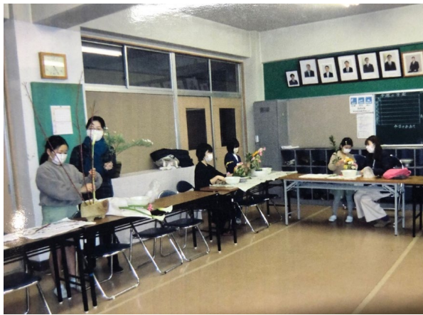
生け花教室「お花と遊ぼう」(第八中BCC)