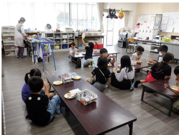
楽しいおやつ時間