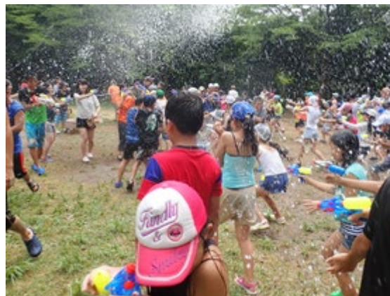
青少年相談員いちかわ子ども村 水遊びを思い切り楽しもう