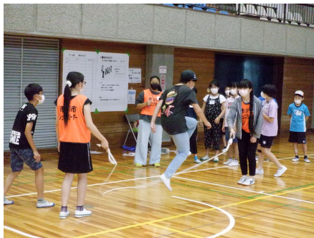
チャレンジランキング 種目：長なわ（チーム対抗戦）での様子