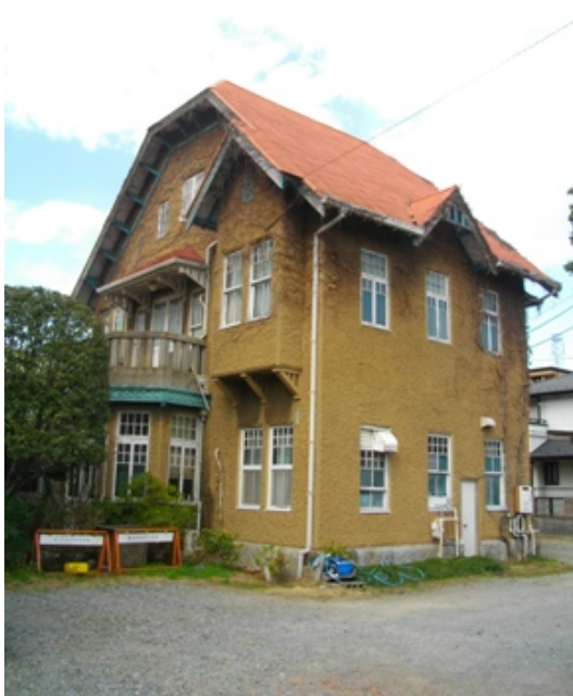
国登録有形文化財である西洋館倶楽部（渡辺家住宅）