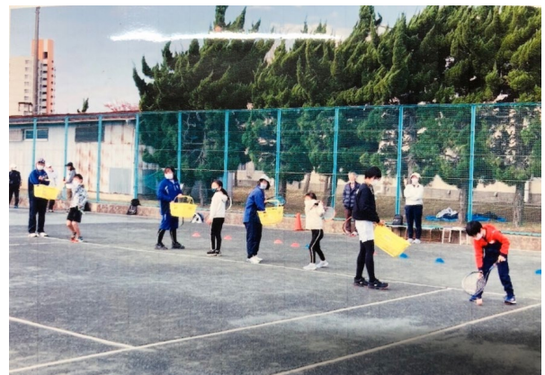
行徳高校テニス部の高校生と連携したスポーツ教室(塩浜学園BCC)