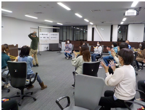
講習会の様子 (コロナ禍でもできる遊びを学ぼう)