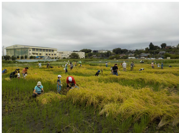
子ども水田 稲刈りの様子

※中止とした活動については、天候不順や新型コロナウイルス感染症拡大防止等の理由によるもの。