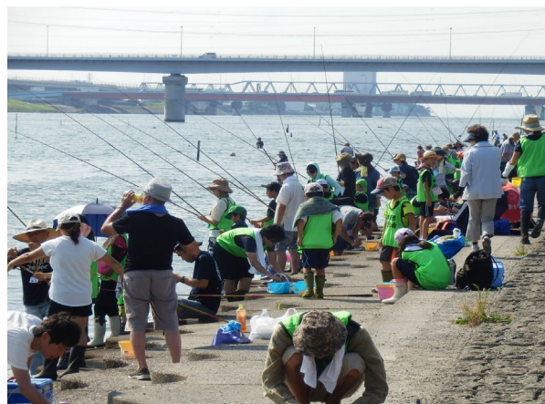
江戸川ではぜ釣り大会