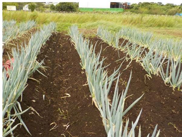
長ねぎ畑 収穫前の様子