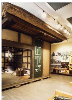
第4室 台地の人々の生活のコーナー