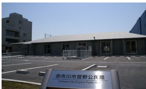
菅野公民館（平成23年4月開館）