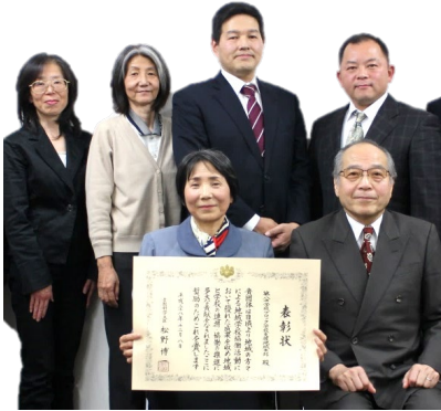
第八中学校ブロックの学校支援コーディネーターズ 「教育長への報告会」