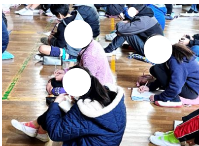
【メモを取りながら聞く6年生】