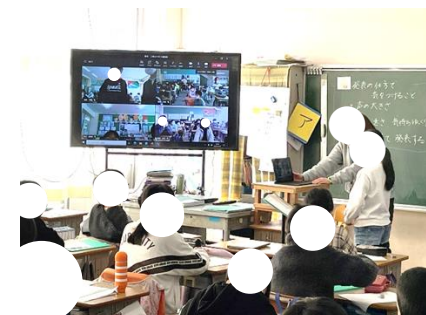
【信篤小学校から質問の様子】