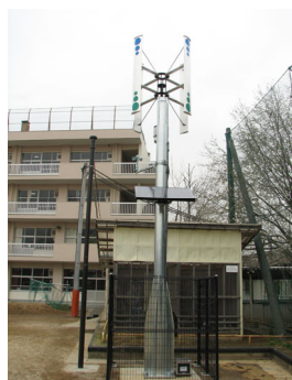
国府台小学校の風力発電