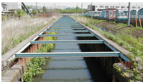
整備前：鋼矢板護岸

これにより、生物の良好な生活環境に配慮するなど、地域の特性を活かした美しい自然環境を保全、創出し、新しいまちづくりと一体となった川づくりを進めています。