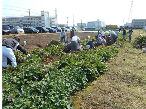
ふれあい農園でのサツマイモの収穫