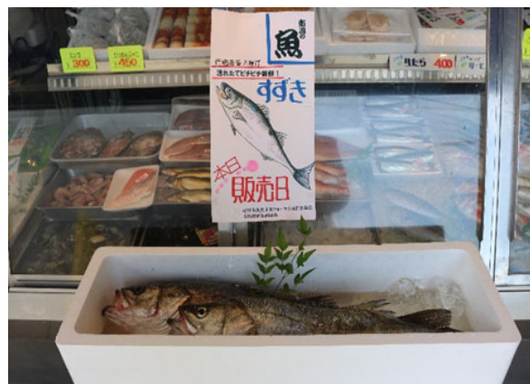
市内鮮魚店での鮮魚販売