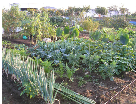
市民農園で栽培している野菜

これは、都市化の進んだ本市において、市民に「農業の大切さ」や「土に触れ作物を育てることの楽しさ」を知ってもらい、野菜の栽培・収穫体験の場を提供し、農業への理解の醸成を図るために行っているものです。