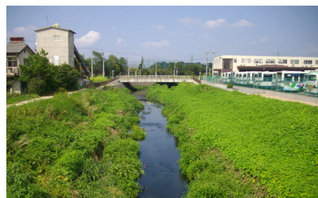
整備後：多自然型護岸