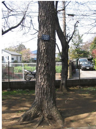
若宮にある協定樹木