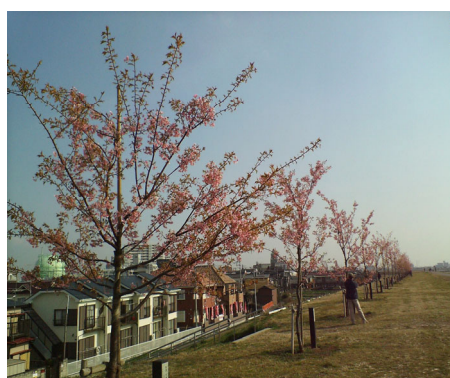
土手に整備された桜並木

また、市は河川を彩る桜並木や自然観察の場となるピオトープ、そして休憩施設等の環境整備を行ってきました。今後も市民がより親しみをもてる水辺空間となるよう取り組んでいきます。