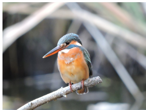
市川の身近な自然と多様な生きもの