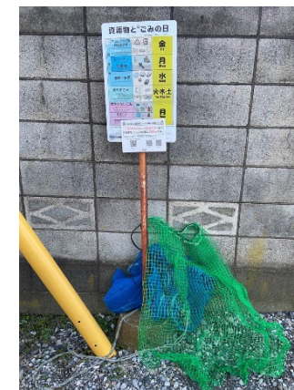
(ごみ集積所の様子)