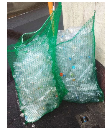
(収集用のネット袋イメージ)