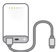
(モバイルバッテリー)