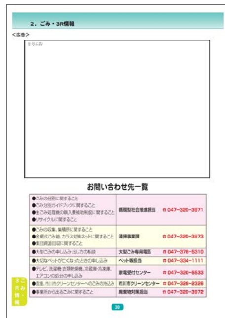
2号広告：表紙4（裏表紙）