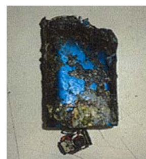
【令和4年4月と11月に実際に混入していた焼け焦げた電子タバコ】