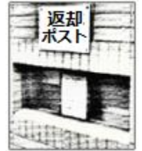
行徳図書館 1階玄関横壁のポスト