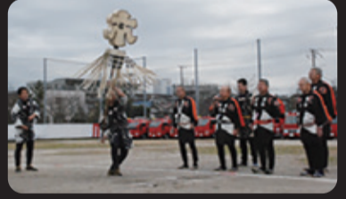
きやり・まとい振り(市川とび職組合)