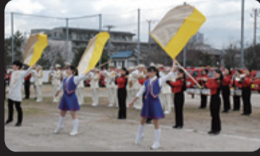
消防音楽隊ドリル(共演:千葉県立市川昂高等学校)