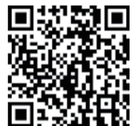
市川市公式WEBサイト