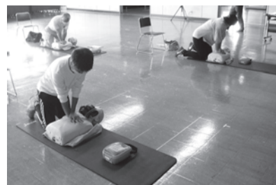
救命講習会の様子