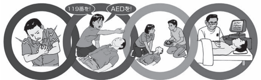
心停止の予防 心停止の早期認識と通報 早い心肺蘇生とAED 救急隊や病院での処置