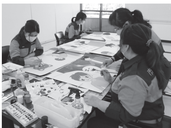
紙芝居を作成しています