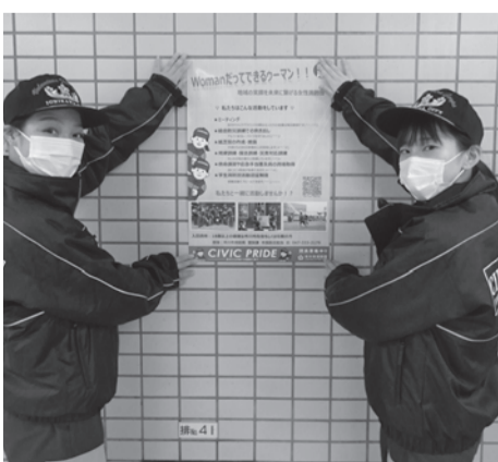
ポスターを掲示しています