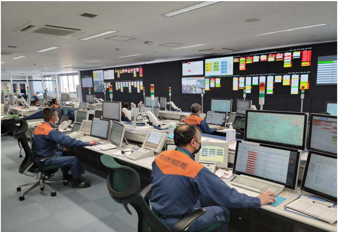
ちば北西部消防指令センター