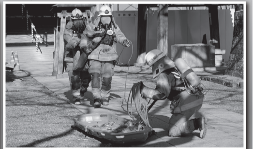
東高度救助隊による要救助者救出訓練