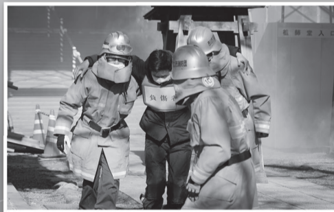
消防団による要救助者救出訓練