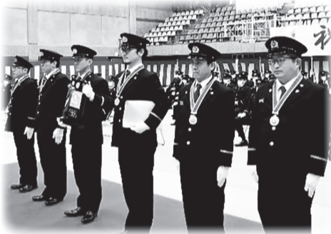
【第29回全国消防操法大会準優勝 表彰の伝達 第6分団】