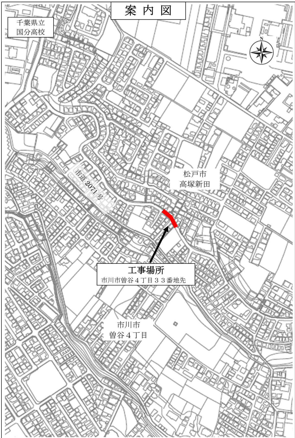
議案第40号の参考図1