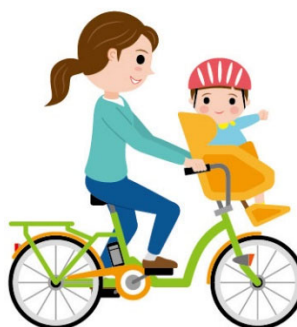
乳幼児のお迎え 女性