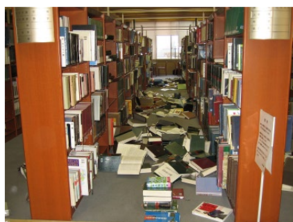
震災直後の中央図書館

令和 5 年度まで連続 15 回礼状を受理しています。 （累積登録データ件数、年間登録データ件数、年間被参照（アクセス）件数によるものです）