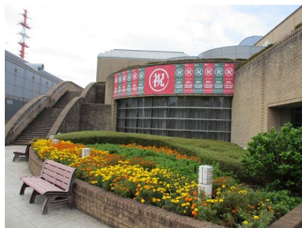
バナーで賑やかに 20 周年を演出