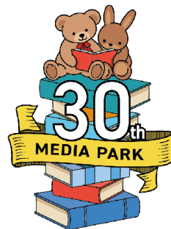
メディアパーク30祭

開館以来30年間皆様に愛される図書館を目指して、職員一同努力を続けてまいりました。今号ではその足跡を、感謝を込めてお伝えいたします。