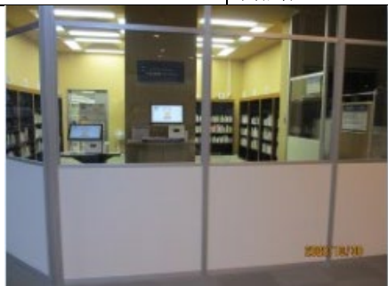
中央図書館の予約受取コーナー