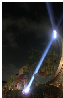
■光のオブジェ点灯