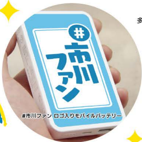
#市川ファン ロゴ入りモバイルバッテリー