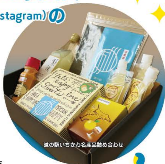
道の駅いちかわ名産品詰め合わせ