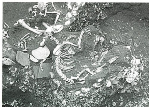
1号イヌの出土状況