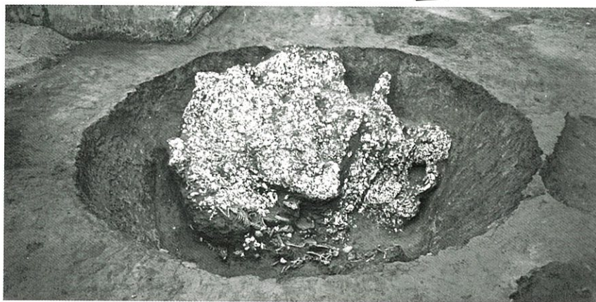
イヌの骨などが出土した土坑（須和田遺跡第6地点）

昭和五十九年（1984）に、須和田遺跡から奈良時代のイヌの骨が十一個体出土しました。この時代のイヌがこれほどまとまって出土したのは、めずらしい事例です。 今回の展示では、遺伝子の分析から、縄文時代以降のイヌの変化、奈良時代の下総国府で飼育されていたイヌの実態に迫っていきます。