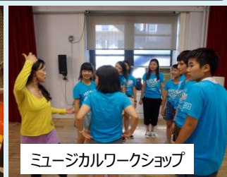
ミュージカルワークショップ