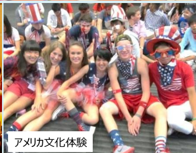
アメリカ文化体験