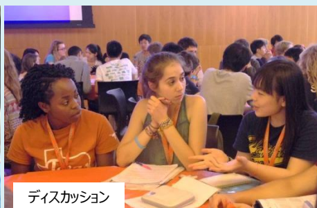
ディスカッション