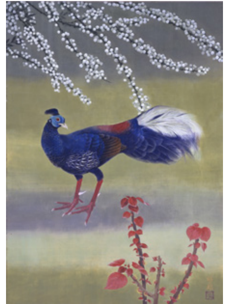
西村昭二郎<春の庭>(1979年)