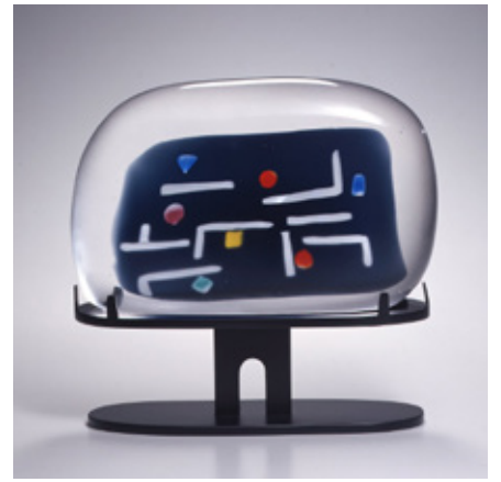
藤田潤<雲の印象>(2007年)