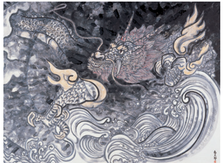
村松秀太郎<龍と天女>部分(1990年)