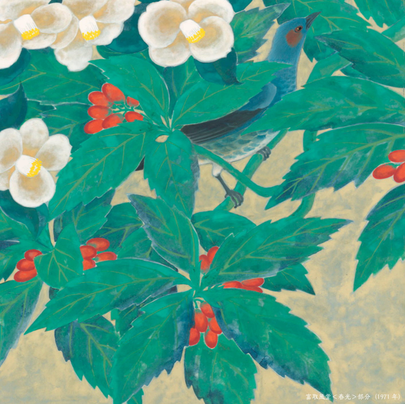
富取風堂<春光>部分 (1971年)