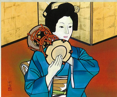
橋本明治《鼓》1959(昭和34)年 株式会社明治座蔵

特別協力: 独立行政法人 日本芸術文化振興会(国立劇場) 松竹株式会社[松竹創業百三十周年記念]/株式会社歌舞伎座/株式会社明治座