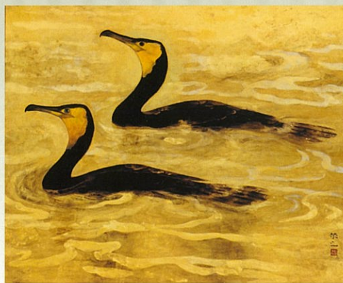
加藤栄三《鴨》1958(昭和33)年 株式会社明治座蔵