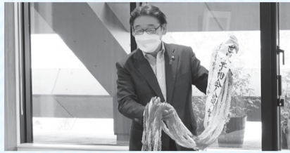
▲市民の団体から平和を願う千羽鶴を受け取る

本市は1984年に「核兵器廃絶平和都市宣言」を行い、核の廃絶に向けての声をあげています。2022年に起きた国際紛争が、間違っても核を使用することがないように、戦闘による唯一の被爆国日本として具体的な行動を起こしていかなければならないと思っています。これからも、市民一人ひとりの生活を守り、生きがいと夢の持てる市川市を目指し、全力で務めてまいります。