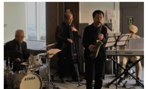
▲本市を拠点に活動するバンドです

問 0711-1688観光政策課(イベント当日午後4時以降=0322-9300同課)