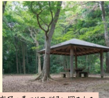
市民の森エリアで緑に囲まれた静かなひとときを