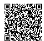
▲種目や会場などはこちら

市民スポーツ教室(定期教室)開催中 市民を対象に土曜日を中心とした種目別のスポーツ教室です。家族や友人を誘って気軽に参加してください。詳しくは市公式Webサイトを確認してください。 種目によってはスポーツ保険、用具などの実費負担あり 物 運動のできる服装、飲料水 問 0318-2013 スポーツ課