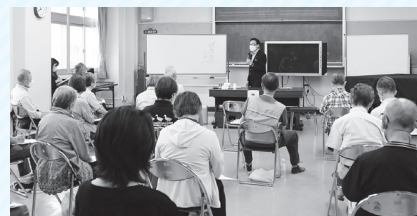
▲真間地区でのタウンミーティングの様子

9月の市議会が終わると、来年度の予算編成が始まります。まずは令和5年度の施政方針を作るために、この先5年間10年間の財政状況を分析します。本市の場合は市民生活の基盤となる重要な公共施設の整備あるいは建て替えが先送りされてきています。例えばクリーンセンターや、斎場の建て替えがそれにあたります。そしてその費用はこれから大きく財政を圧迫することが容易に想像できたものですが、どういうわけか真剣に議論されず宿題となっていました。比較的財源が豊かで不交付団体(国から普通交付税を受け取らない団体)となる本市なので