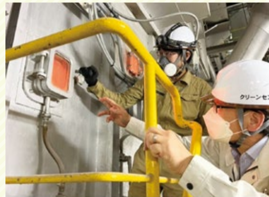
▲クリーンセンターを視察する様子

先月、市長名で令和5年度予算編成方針を発表し、来年度の重要項目と方針を各部へ通知いたしました。この方針は、来年度の予算はもちろんですが、5年後・10年後の財政見通しも勘案された、持続可能な市川市政を作るものにしていかなければなりません。具体的に申し上げますと、先送り続けてきた「クリーンセンター」「斎場」の建て替えという市民生活の基盤整備を行いつつ、すでにお伝えしている給食費の無償化や福祉・医療に配慮してまいります。市川市はこの間、高額な予算が必要となることを理由に「クリーンセンター」「斎場」の建て替えを先送りしてきたといわれても仕方ありません。そこで、来年度一般会計の予算規模は維持しつつ、各部の事業予算のうち義務的経費を除いたマイナス5%シーリングで要求してもらうことをお願いしました。25部ある各部は、市民の要望にしっかりと応える姿勢を持ち、無駄を省き、優先順位を立てるなか、前年度の95%で事業運営を着実に進めてもらいたいと考えています。そ