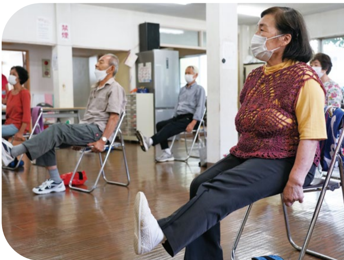
▲市川みんなで体操の様子