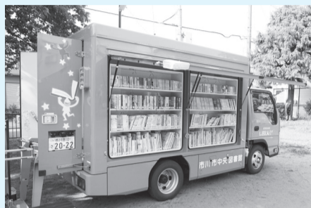
▲自動車図書館「みどり号」

人 市内在住の生後4カ月～1歳の誕生日を迎えるまでの乳児とその保護者、申込順①9組②15組