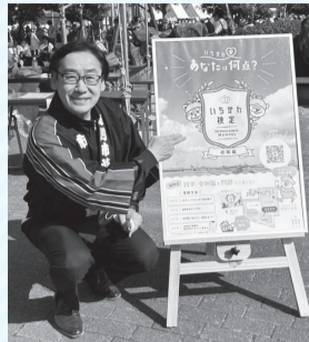
▲「いちかわ検定初級」ポスターと一緒に

日が暮れて、市制施行88年の祝砲として約2分間の短い花火を打ち上げたのですがお気づきになられたでしょうか。これからもコロナ感染に注意しながら、まちの魅力をさらに作り出し、皆さんに喜んでもらえる施策を行っていきたくと思っています。