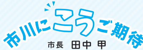
市長 田中 甲 Tanaka Koh