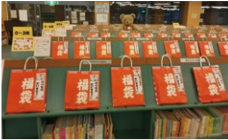
▲こどもとしゃかん「本の福袋」

会場 1月5日(木)①午前9時30分=信篤図書館、南行徳図書館②午前10時=中央図書館・こどもとしゃかん、行徳図書館。中央図書館一般向け以外なくなり次第終了。中央図書館一般向けは1月9日(祝)午後6時まで