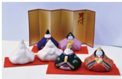
▲自由に絵を描いてオリジナルのひな人形を作ろう