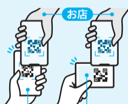
スマートフォンまたはカード利用者