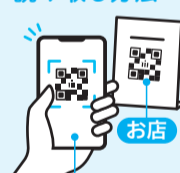
スマートフォン利用者