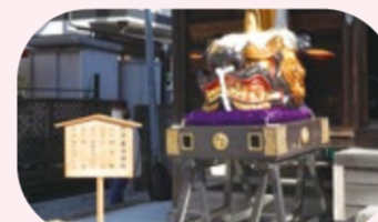
▲河原春日神社の獅子頭