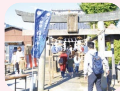
▲河原春日神社の獅子頭

11月3日(祝)午前10時～午後4時(荒天中止) 行徳・南行徳地域の16の神社、行徳ふれあい伝承館、行徳神興ミュージアム ☎357-2061行徳・南行徳神社めぐり実行委員会(有限会社中台製作所内)