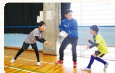
◀全力でゲームに臨む参加者たち