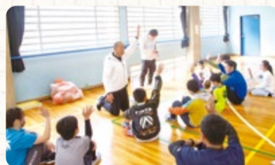
◀みんなで話合ってゲームのクリアを目指します

「いちかわちょこっと伝え隊」が、今号から新たに始まります。隊員たちが興味を持ったことや紹介したいことを、ちょこっとご紹介。これから、いろいろな情報をお伝えしますのでお楽しみに。