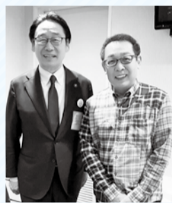
▲2/28東京国際フォーラムにて