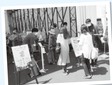
▲昨年も多くの方でにぎわいました