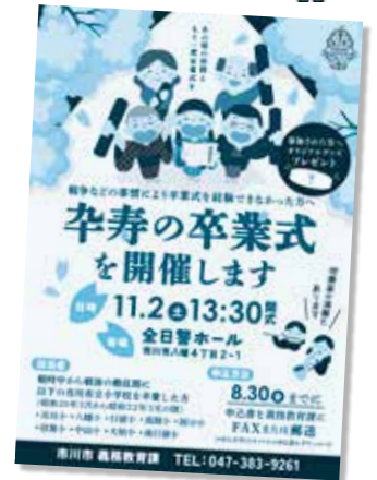
▲募集チラシ配布中