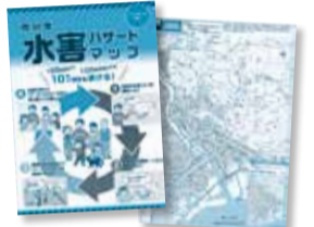
市川市水害ハザードマップ

自宅の水害リスクを確認しておきましょう。安全が確保できれば自宅上階や知人宅への避難も選択肢の一つです。 また、「いつ」「だれが」「なにををするのか」といった「マイタイムライン」を決めておくことで安心です。詳細は同マップで確認してください。