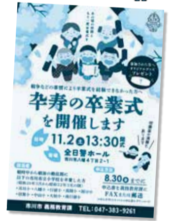
▲募集チラシ配布中