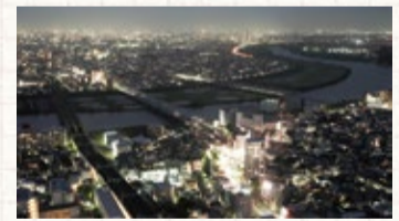
▲JR市川駅から葛飾区方面を望む夜景