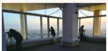
▲フォトグラフィブニングの様子