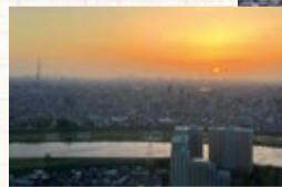
▲味わい深い夕暮れ時の空の移ろい