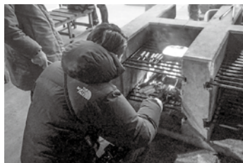
▲好きなものを焼いて食べましょう