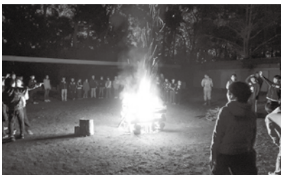
▲炎を囲んでひと休み