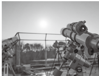
▲専門的な望遠鏡を使って観察します

夜の天体観望の前に、豚汁を作って食べ、体を温めます。大町の自然に触れながら、大人と子どもが協力して全員で調理します。