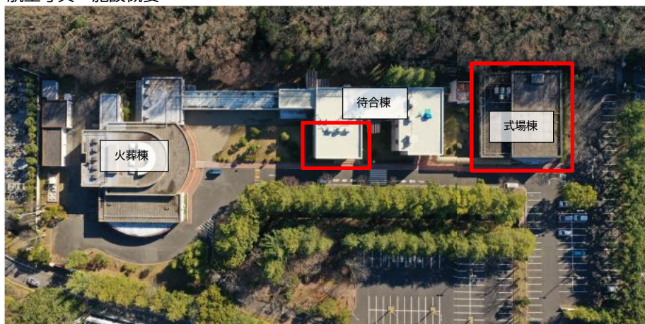
図3-(1)-1 航空写真・施設概要

市川市斎場には、第1式場（200席：500～1,000人対応）、第2式場（50席：100～200人対応）、第3式場（100席：200～500人対応）の3つの式場が設置されており、市の直営で運営している。通夜、告別式で利用され、宿泊も可能である。