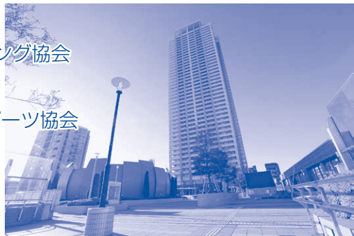
アイ・リンクタウン

その他 ①雨天でも開催いたします。（荒天等により中止となる場合がございます） ②交通ルールを守り、事故防止にご協力ください。 ③ゴミは、必ず自分でお持ち帰りください。 ④宿泊はお手数ですが、各自でご手配ください。