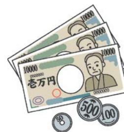
(消費者庁イラスト集より)

貯蓄がなく入院費用が払えない場合には、医療費がまかなえる貯蓄ができるまでのつなぎとして医療保険を利用するとよいでしょう。