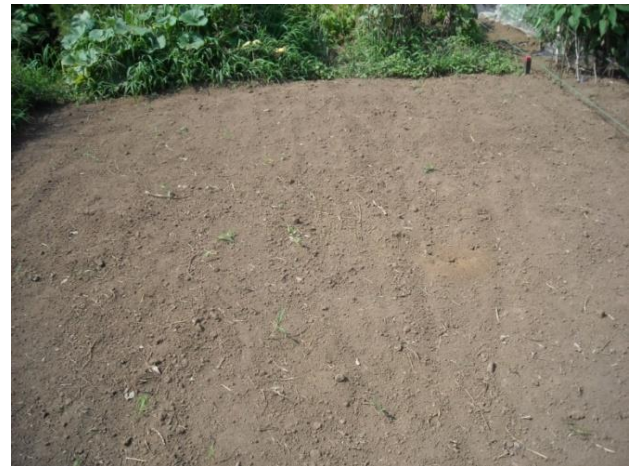
【整地された区画の例】