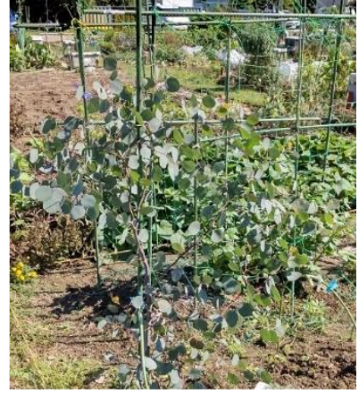
【左からパパイヤ、月桂樹、ユーカリ】