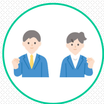
学生のうちからできること