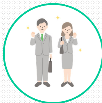
社会人だからできること