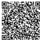
ios 端末インストール用