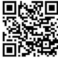
オンライン申請 QR コード