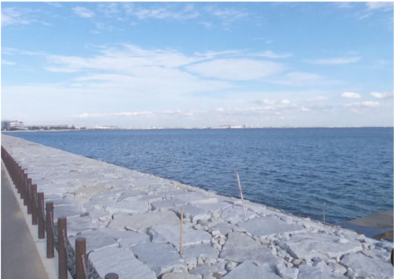
塩浜三番瀬公園付近からみたロケーション（塩浜 2 丁目 31 番地先）

双方にとってより良い公募資料とするための条件整理を行うことを目的としておりますので、積極的なご提案をお願いいたします。