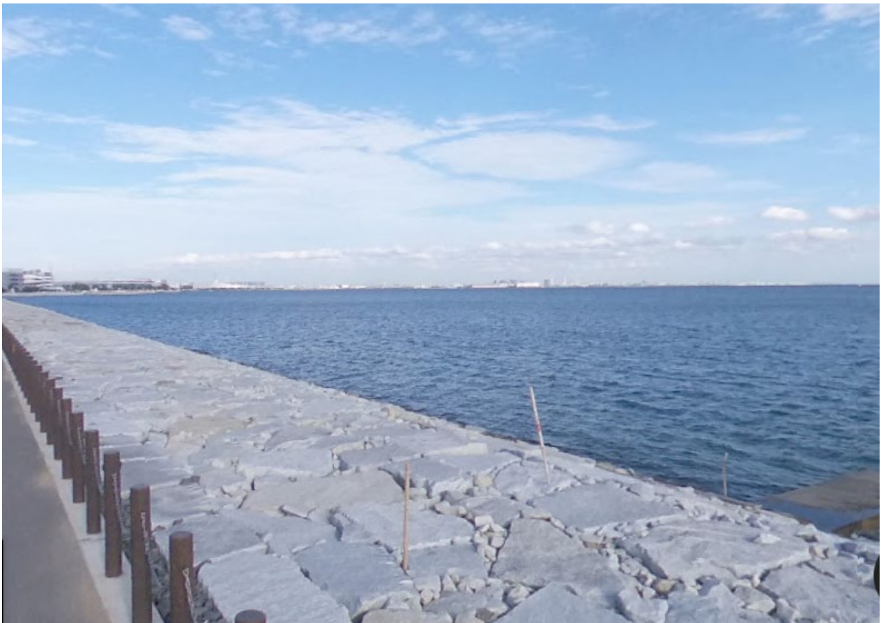
塩浜三番瀬公園付近からみたロケーション（塩浜 2 丁目 31 番地先）

双方にとってより良い公募資料とするための条件整理を行うことを目的としておりますので、積極的なご提案をお願いいたします。