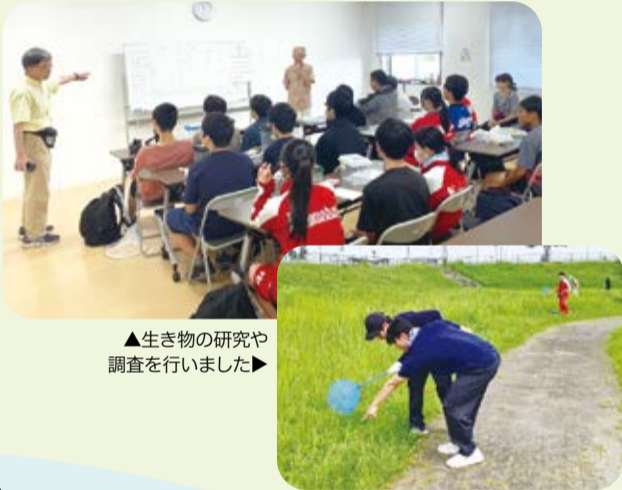
▲生き物の研究や調査を行いました▶

市内の中学・高等学校5校の生物系部活動などの生徒と市民団体、本市が行う協働モニタリング