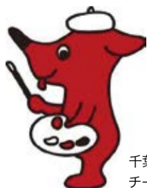
千葉県マスコットキャラクター チーパくん