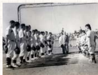
◀国府台球場の試合の様子 昭和30(1955)年ごろ