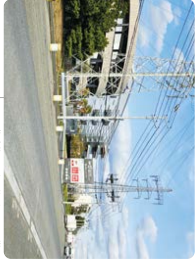
物流施設のある塩浜1丁目の様子 令和6年(2024)