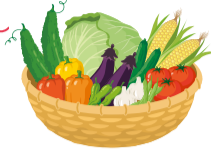
◀これから旬を迎える夏野菜

1 旬の野菜を活用 栄養価が高くうまみが強いので、おいしく食べられ、価格も抑えられます。