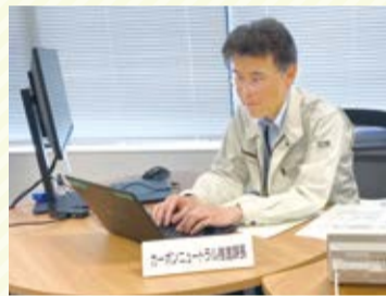
▲高浜カーボンニュートラル推進課長

私が休日に所用で市役所に来ると、いつも机に向かい仕事をしている姿をみてきました。それが今回の結果を生み出したと思っています。