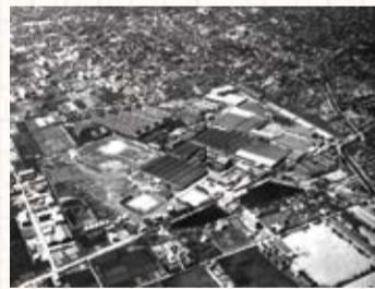
◀日本毛織中山工場全景 昭和40(1965)年ごろ (創業は大正9(1920)年の上毛モスリン 中山工場、現ニッケコルトンプラザ)

大正時代に市域の都市化がはじまり、水田が広がっていた総武線線路の南側には、日本毛織中山工場のような大工場が設立されます。昭和9(1934)年に市川市が誕生し、太平洋戦争後に軍用地があった国府台地域は、学校や運動施設などが新設され文教の町になりました。現在では工場跡地などに高層マンションが建ち、東京湾岸の埋立地には工場や物流倉庫が並んだ様子が見られます。