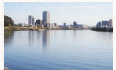
▲里見公園下の江戸川から望む市川方面 令和6(2024)年2月