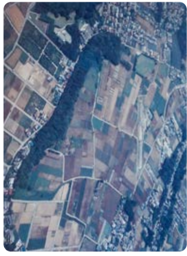
北国分駅周辺写真 平成2年(1990)ごろ