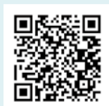
▲いちかわ生きものマップ