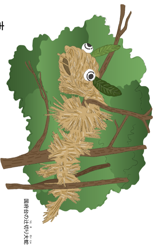
国府台の辻切り大蛇