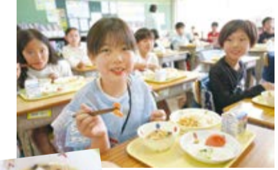
◀へビ型のニンジンが入った給食

●毎日、干支の生き物で型抜きした野菜6個程度を給食に入れ、当たった児童に干支のシールをプレゼントしています。当たる確率は1/100程度。給食の時間がより楽しく、また苦手な野菜を少しでも食べられるように取り組んでいます。