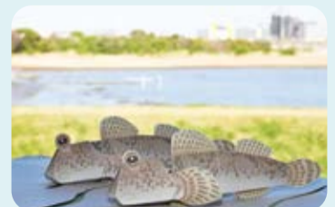
▲トビハゼのクラフト