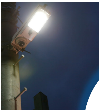
△カメラ付き防犯灯