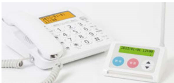
△迷惑電話防止機能付き電話機