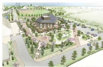
△ぴあぱーく妙典COCO(ココ)