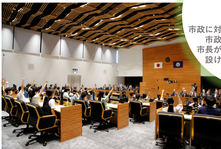
△児童議会の様子（令和6年度）