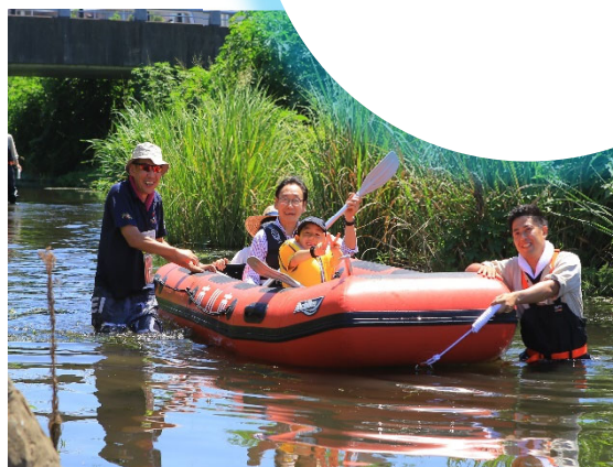
△いしかわ水辺クルーズ