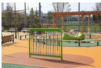
△インクルーシブ遊具