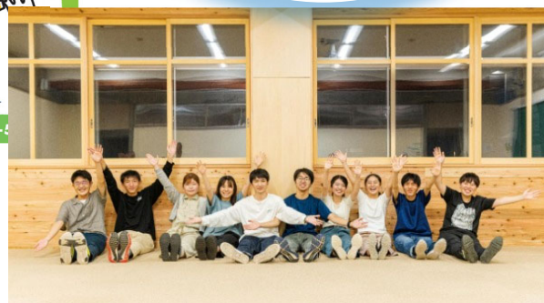
△エコキャンパスツアー (@千葉商科大学)